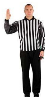
Vrácení do brankoviště s míčem