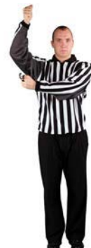
Hra vysokou holí