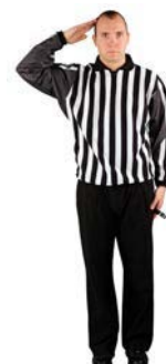
Nebezpečný úder na hlavu