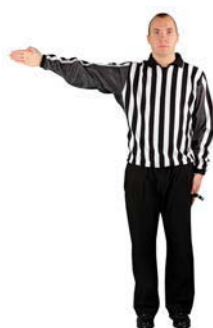
Míč v držení, směr hry