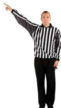
Osobní trest do konce utkání