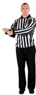
Doražení míče do branky, branka neplatí