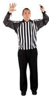
Šestý hráč na hřišti při hře bez brankáře