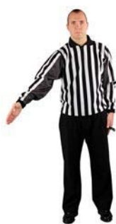
Porušení pravidla o brankovišti